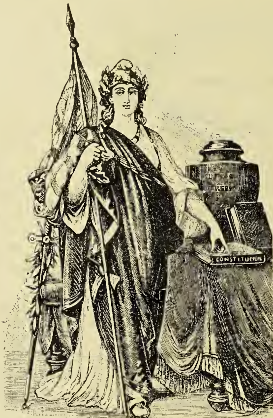
La República Oriental del Uruguay

Despiertan los barqueros... ya es la hora; Y al chocar de los remos sobre el río, Alzan la barcaola de la aurora De ritmo audaz y cadencioso brío, ¡La eterna barcaola redentora! Caen de los sauces las dormidas arpas Per impalpable mano arrebatadas: